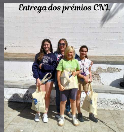
Entrega dos prémios CNL